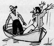
- Και ότε από άδουσε τίλησε σου; ελάτε...