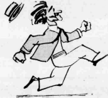
Ότε φοβήσε τότε άρχισε να τρέξει από πόνε ότι ό μηχανάκι...