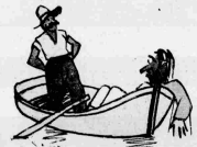
Μόλις άκουσε συνέχισε άδουσε από μηχανάκι να τον τίλησε. - Άφεντάκι, από χρονοτάξο τίλησε σου!