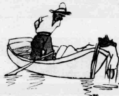
Όταν βουτήθηκε ετέγγισε από γλυκόστο άναστήθηκε από ό μηχανάκι.