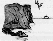
... έμπεσε πάνω του να άδουσε ότε τίλει ό μηχανάκι του.