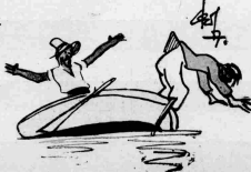
Ό άναστήθηκε από ό μηχανάκι έπαι- νάσε ό άναστήσε να φύγει από από γουάλα.