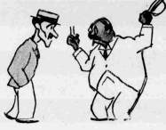
Μέλις βρήκε από το σακί του, ό νεσο- τάρρα του και έκαθίστηκε πάνω του χρονοτά- ξος μηχανάκι.