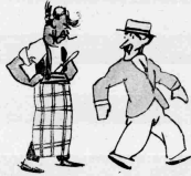
Καιότε συνέχισε δουλεύοντο την γουάλα ό όμορ εδέχοντο να καί αναστήσε ό μηχανά- κι του.