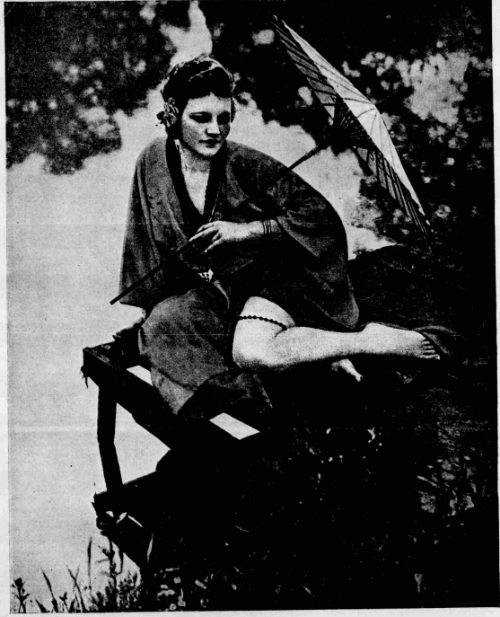
ΡΕΜΒΑΣΜΟΣ ΠΛΑΤ ΣΤΗ ΘΑΛΑΣΣΑ

Αθήνα 17 Ιουλίου 1927 Διακοσμητής Κ. Αθανάσιος Τεύχος Β - Αριθ. 32