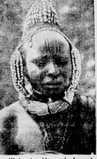
Η ανώτερη Αρμενιά... Η ανώτερη Αρμενιά... Η ανώτερη Αρμενιά...