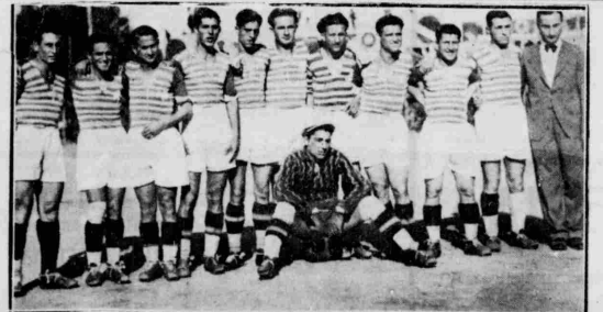
Ἡ ποδοσφαιρικὴ ομάδα τῶν Ἀθηνῶν, ἡ πρωτογεννημένη ὄμιλος τοῦ Παναθηναϊκοῦ