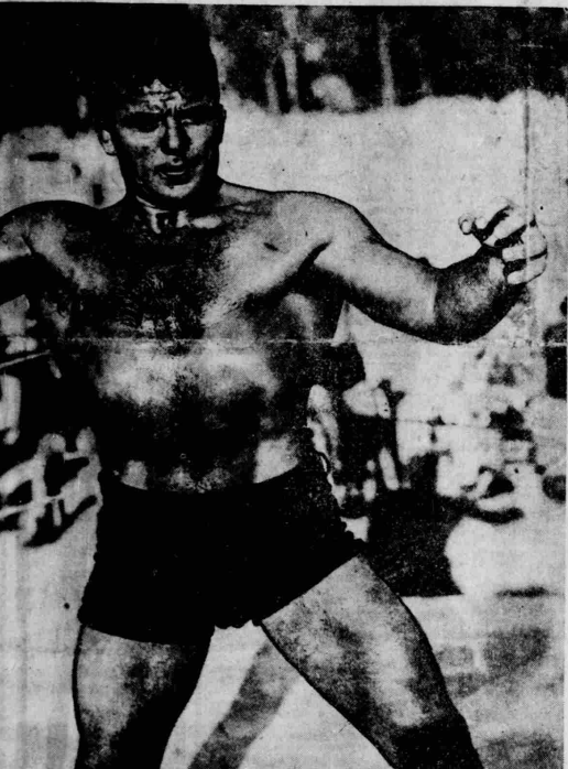
Ὁ παγκόσμιος παλαιστής τῶν Τζιμ Λόντος ἠττήθηκε ἀπὸ τοῦ ἱρλανδοῦ Μ. Μαχόνεϊ εἰς Βοστώνην ἔχων τὸν τίτλον του