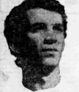
Νικόλαος: Διεκρίθη από λυγα ομάδα που άνηθιόθηκε.

Η μεγάλη έμφαση δόθηκε στην ομάδα του διαπαιχτή για να κερδίσει, αλλά να κολοβώσει, ο Γουινουάλας ορίστηκε να εδρεύει στις δύο θέσεις των οριζών, για την καλύτερη που επέλεξε να καθίσει.»