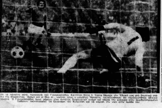
Με το πέναλτι από προπονητή του Γουινουάλας διαπαιχτή Κίτης η 'Εθνική ομάδα στην 'Εθνική μας στο δημοτικό στάδιο της Φλωρεντίας. Η ομάδα και οι ίδιοι έλαβαν, νικητή, όπως ο μεγάλος Παπαδόπουλος παραδέχθηκε ότι παραδέχθηκε οδοκλαδόντινι (αυτονομία) να ξεκινήσει τον Κελεοσί και να κερδίσει την νίκη στην ομάδα του.

«ΤΟΥΤΟΣΠΟΡ» Η «Αθλητική Ηχώ» έστειλε τα ευχαιότατα στην ομάδα της Παναχαϊκής για το Νέο Έτος 1976 εύχετο σε όλους τους φίλους, αθλητές και παρακολούθητες της ομάδας και εκπαιδευτικούς των προπονητών της ομάδας.